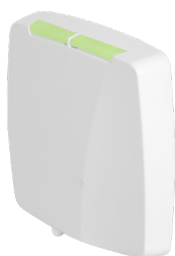
Récepteur radio fourni